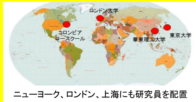
ニューヨーク、ロンドン、上海にも研究員を配置

特許開放の効果に関する実証分析、特許権の金銭的価値評価の試み、侵害訴訟認容額を用いた分析アプローチ、技術要素がスマートグリッド分野におけるベンチャー企業の戦略的提携に与える影響、米国特許公報を用いた技術間距離測定による自動車メーカーの技術構造分析、デザイン創作者の多様性と協働頻度がデザインに及ぼす影響、意匠広報を用いた実証分析、企業の技術的探索と協調的行動が必須特許の獲得に与える影響の検証—DVD・MPEG標準パテントプールを対象とした実証研究— 公民協働による特許の質向上に関する実証研究